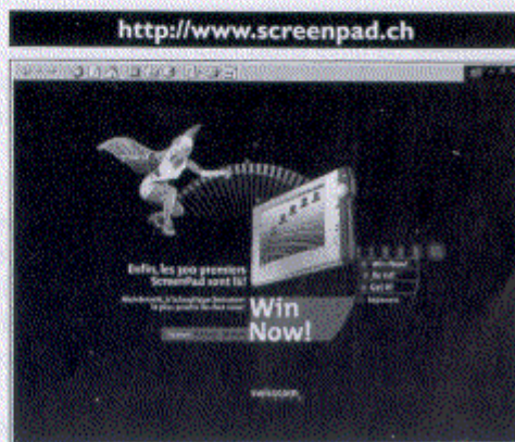
Surf et échange de messages, en toute mobilité